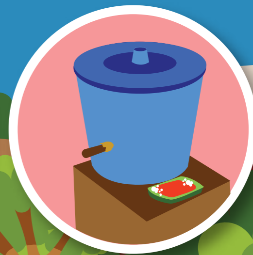
Menyediakan Tempat Cuci Tangan